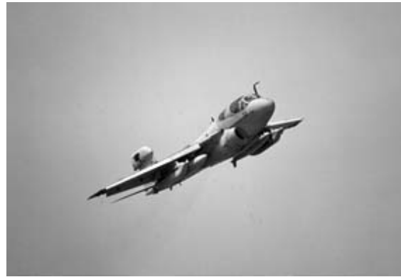
米軍機の低空飛行訓練ルート (北方ルートを除く)