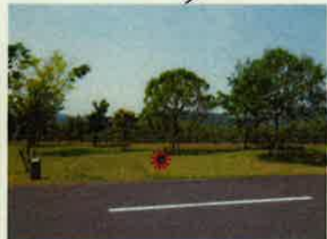
B-10 ☆テントスペース 5m × 5m バックスペース 6m