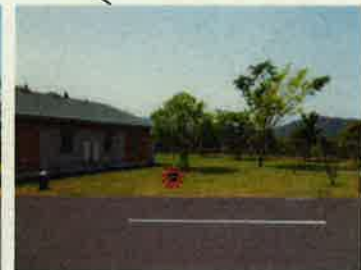
B-11 ☆テントスペース 5m × 5m + 2 バックスペース 6m