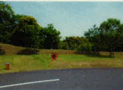
B-8 ☆テントスペース 5m × 5m バックスペース 2m

△ テント横スペース ☆水栓柱 & 電気コンセント側 テントスペース 縦×横+横スペース