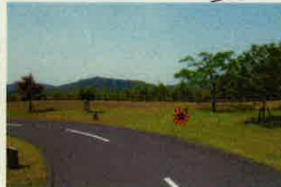
B-9 ☆テントスペース 5m × 5m ただし斜め 左サイドに 3.5m × 5m スペースあり