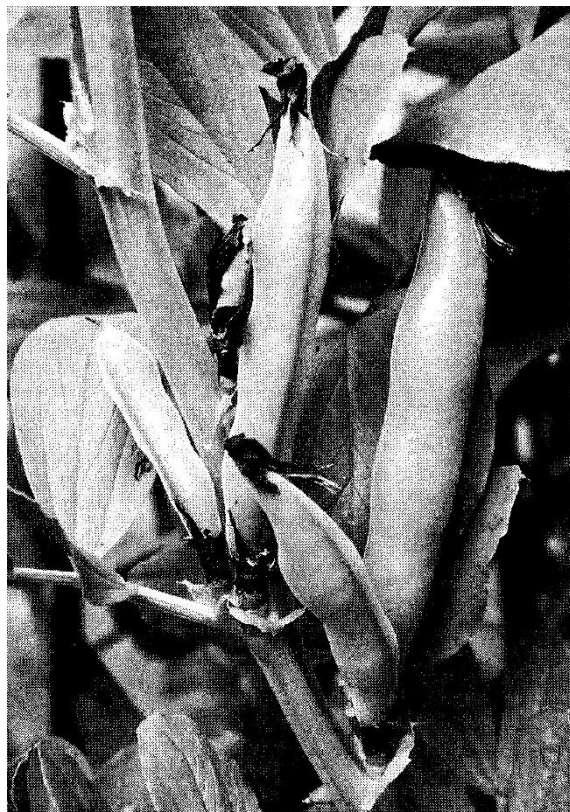
鮮やかな濃緑のさやをつける

冬越し後、2月下旬～3月上旬に追肥します。株が育ち、茎が枝分かれしてきたら倒れないように株元に土寄せしてください。4～5月頃に開花すると(写真)、間もなく小さなさやがつきます。上を向いていたさやが下を向き、背の部分が黒褐色になったら収穫適期です。